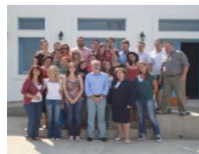
Κόθηρα 2011. Οι συμμετέχοντες στο προαύλιο του χώρου διεξαγωγής των μαθημάτων

Στο πλαίσιο του Προγράμματος διοργανώθηκε ημερίδα με τίτλο Το Πρόγραμμα των Μονοπατιών και τα Οφέλη του για την Επιχειρηματικότητα - Προώθηση του Τουρισμού μέσα από Περιβαλλοντικές Δραστηριότητες . Η ημερίδα που πραγματοποιήθηκε στις 3 Οκτωβρίου 2011 στη Χώρα των Κυθήρων, συνδιοργανώθηκε από το Ε.Κε.Π.Ε.Κ. και το Κυθηραϊκό Ίδρυμα Πολιτισμού και Ανάπτυξης.