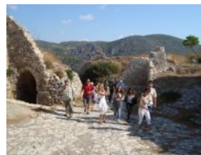
Κόθηρα 2011. Περιήγηση στο Δίκτυο Μονοπατιών